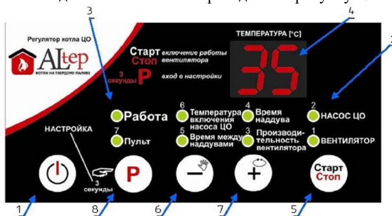
Рисунок 2 – Зовнішній вигляд передньої панелі контролера

6.2 Зовнішній вигляд блока автоматики приведено на рисунку 2.